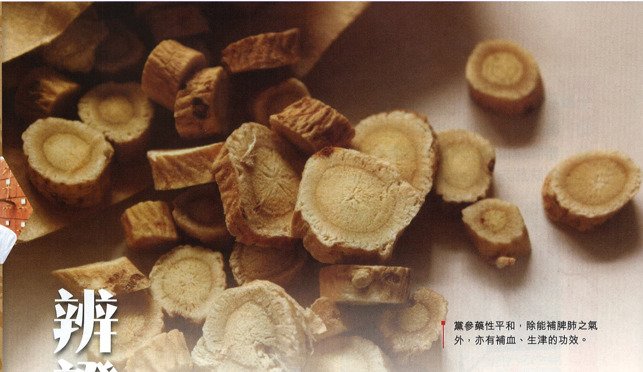
黨參藥性平和，除能補脾肺之氣外，亦有補血、生津的功效。

氣血兩虛證 ，是指氣虛與血虛同時存在的證候。臨床上所見，多由下列三個原因引起：第一是久病不癒，以致氣血同時損耗，例如慢性腎炎、再生障礙性貧血等。第二是血虛無以化氣。先有失血，由於「血為氣之母」（意即血能生氣，亦能載氣），持續性失血則令氣隨血耗，例如女性之功能性子宮出血，或消化道潰瘍的慢性出血，都會引起明顯的貧血以致患者能量低下，容易疲勞。第三是氣虛不能生血。先因氣虛不能進行化生，以致血少。一般癌病患者晚期多有脾胃虛弱的情況，以致無力化生血液，造成氣血兩虛的惡病質。