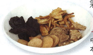
中醫治療血虛的基本方藥是四物湯。