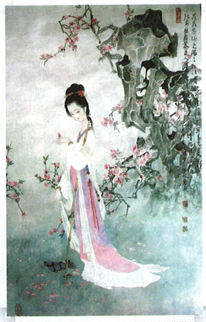
林黛玉一直要服人參養榮丸。

先天不足，後天則嬌生慣養，更不幸患上肺癆病，久治不癒，導致氣血雙虧；再加上她寄人籬下，多愁善感，愛情亦不能由自己作主，這些情志因素亦令她虛上加虛，所以一直要服人參養榮丸。⊕