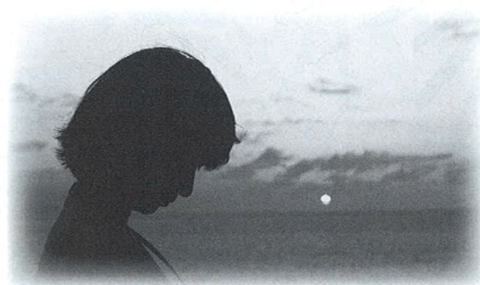
情志內傷、耗損心血。

上期講過「陰虛」，今期會談談「血虛」問題。「血虛」的成因有很多，可以是失血、瘀血阻滯或陰血暗耗等，而情志內傷也可耗損心血。