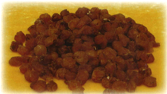
龍眼肉味甘性溫，有補益心脾、養血安神的作用。

補血藥中的龍眼肉，可以藥食兩用。其味甘性溫，有補益心脾、養血安神的作用。臨床用治氣血不足，心悸怔忡，健忘失眠，血虛萎黃等。藥理研究顯示，龍眼肉有強壯身體、抗衰老和抗腫瘤的作用。說到龍眼入