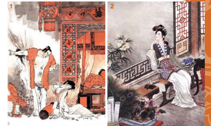
1 夏金桂(右)是薛蟠(左)的正室。 2 香菱差點被夏金桂毒死。

中藥方面，含砷的礦物類藥有砒石和雄黃。砒石的主要成份為三氧化二砷(即砒霜)，為劇毒之品，外用有攻毒殺蟲，蝕瘡去腐的作用；內服則驅寒、化痰和平喘。近年發現砒霜對癌細胞有特定的毒性，主要通過誘導細胞凋亡令白血病(血癌)細胞死亡，國內及香港以及其他國家用來治療白血病，在某些類型的血癌中有一定效果，但仍需進一步研究，深入的分析、總結及提高，這是以毒攻毒的成功例子。至於雄黃，主要成份為二硫化二砷( As_2S_2 )，亦是有毒之品，其功效為解毒、殺蟲，臨床用治癰腫疔瘡、濕疹疥癬及蛇蟲咬傷。