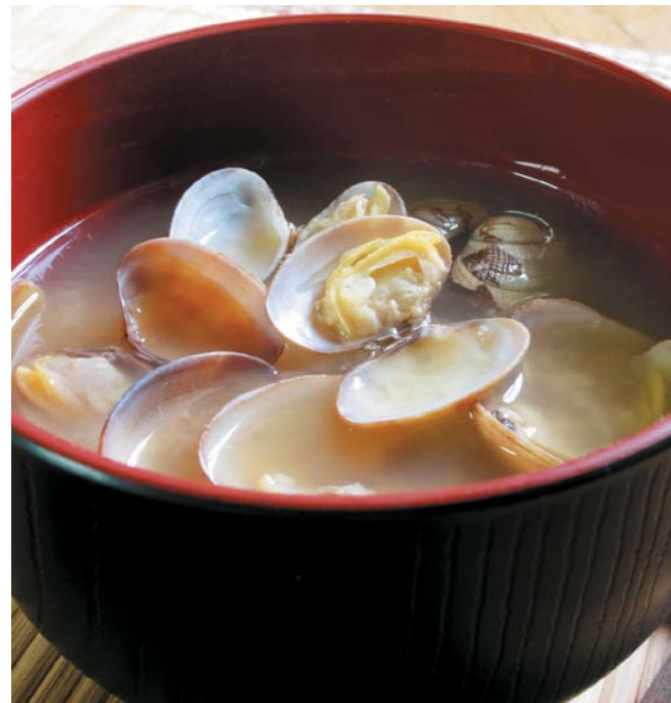
貝殼類的有機砷化合物含量較高。

砷通過肺、胃腸道及皮膚吸收，吸入人體內的砷隨血液分佈到肝、腎、肺及脾臟，約2週後分佈到皮膚、頭髮及骨骼，並且大量積聚於白細胞內。約5至10%經糞便排出，90至95%從尿液排泄。砷進入人體後，主要作用於酶蛋白，使其活性減弱或失去，影響其正常功能，從而抑制細胞的氧化和呼吸；與紅細胞內的血紅蛋白結合，引發溶血而造成貧血；損害細胞染色體，影響細胞的正常分裂；損害神經細胞，引