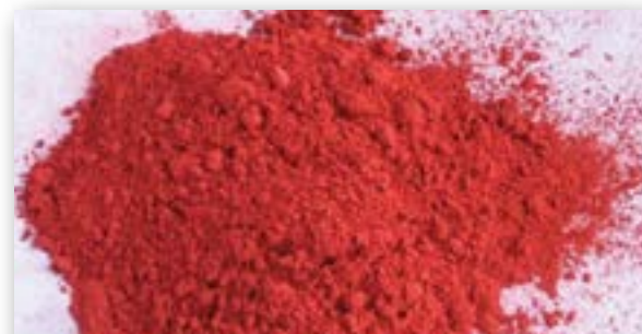
▲朱砂的成份主要是硫化汞，有解毒消腫之效。

其實在日常生活中，我們也有機會接觸到汞或其化合物，例如元素汞用於溫度計。血壓計和牙科使用的銀汞合金；汞的無機鹽存在於一些外用藥（包括中西藥）、導瀉藥（如甘汞）、製造塑料的催化劑等；有機汞則存在於油漆、殺蟲劑、化妝品等。在生產上述產物的工業過程中，亦會產生汞蒸氣。汞的毒性損傷主要來自無機汞。