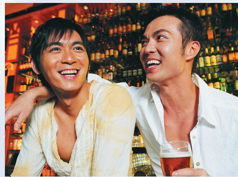
嗜煙好酒容易患上口腔癌。

□ 口腔癌的致病因素有吸煙、酗酒、嚼食檳榔、感染（口腔不潔、牙齒狀況差）、環境因素（輻射、污染）、自身免疫失調等。其臨床表現包括口腔內黏膜表面顏色變白或出現紅色斑塊；口腔超過兩周以上未癒合的黏膜潰瘍；口內或頸部有不明原因之腫塊或出血，觸摸時不一定疼痛；舌頭活動性受到限制，導致咀嚼、吞嚥或說話困難，舌頭半側知覺喪失或麻木；頸部持續腫大的淋巴結等。