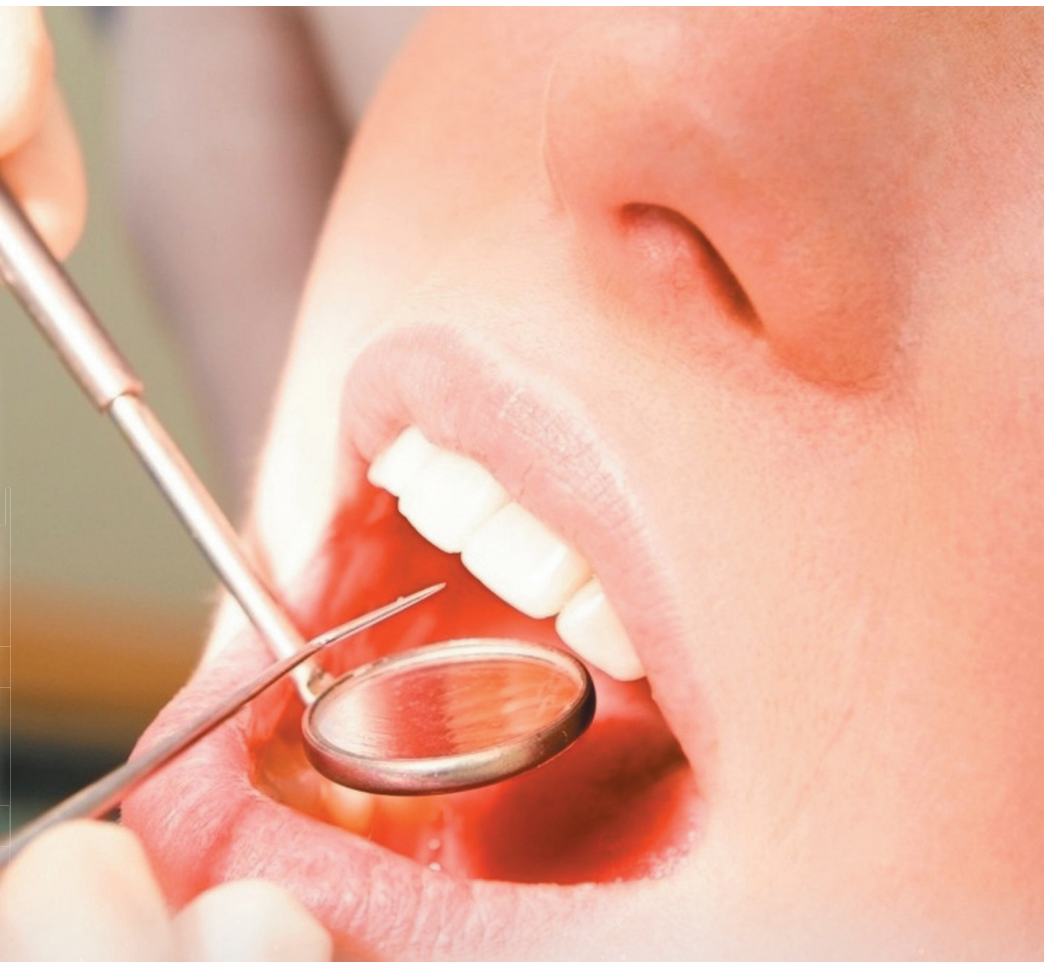
定期檢查牙齒，注意口腔衛生，可預防口腔癌。