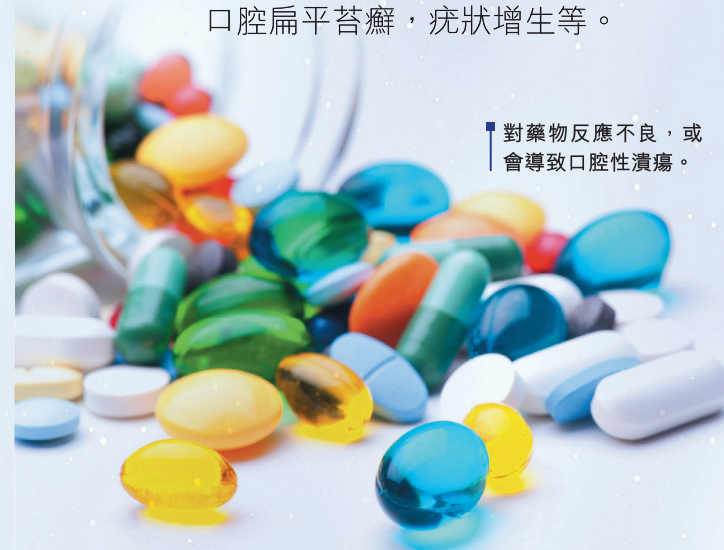
對藥物反應不良，或會導致口腔性潰瘍。

口腔癌的癌前病變及癌前狀態/病變包括口腔白斑症，屬口腔黏膜病變，指口腔黏膜上擦不掉的白色斑塊，為臨床上最常見之口腔癌癌前病變；口腔紅斑症，為口腔黏膜出現紅色斑點，高達65%會轉變為口腔癌。此外，還有持續不癒合之口腔慢性潰瘍（超過兩周仍未癒合），口腔黏膜下纖維化，增生性念珠菌病，日曬唇炎，口腔扁平苔癬，疣狀增生等。