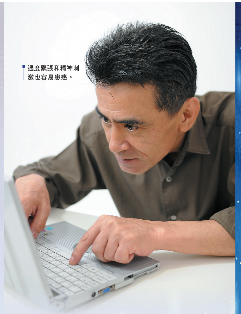
過度緊張和精神刺激也容易患癌。